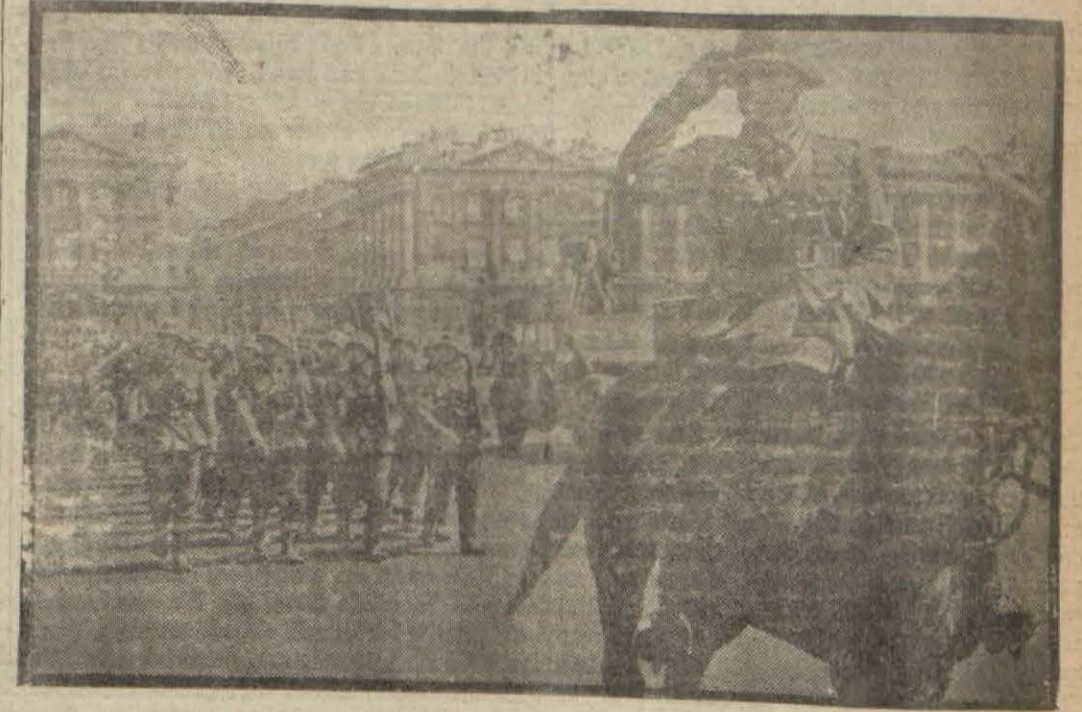
Parise giren Alman askerleri Etuval meydanında meçhul asker âbidesi önünden geçerken

Fransızlar: "Mevzuubahs olan umumî Avrupa mese- lesidir," diyor, Almanlar: "Demokrat markalı bir beynelmîlel konferans, hayaldir," cevabını veriyorlar