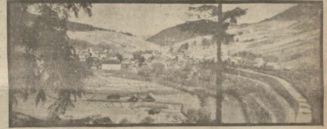
Bukovinadan bir görünüş

İşgal mıntakası ile muhabere munkati, Romanyada bütün eğlence yerleri kapalı, tediyat tatil edildi