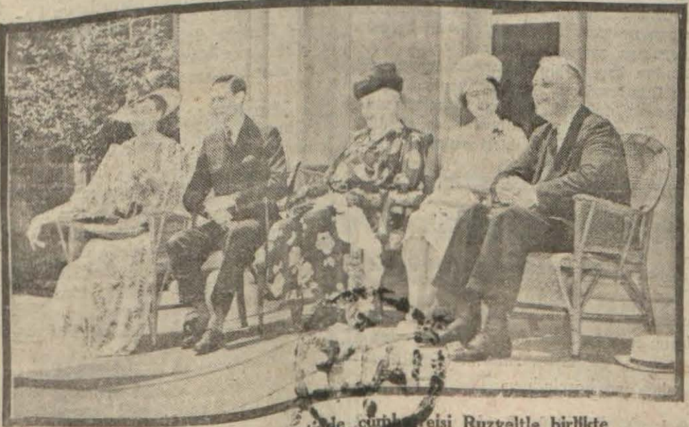
İngiltere kralı son Amerika seyahatinde cumhurbaşkanı Reisi Ruzveltle birlikte

Yeni Reiscümhur namzedi de İngiltereye yardım taraftarı!